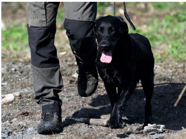
Grundtræning er kontrollerende aktivitet.

Uanset hvor hårdt gående de er, under træning og jagt, så er de fuldstændig rolige og nemme at have inde i huset.